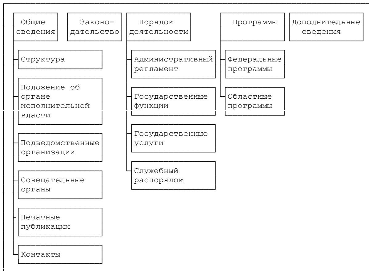
Схема навигационной панели интернет-сайта органа исполнительной власти